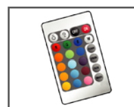
Télécommande RGB incluse